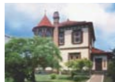
弘前学院外人宣教師館

弘前学院大学は、3学部4学科および大学院2研究科を有する総合大学です。清新で専門性の高い教育と研究を通して幅広い文化の創造、保健医療福祉の向上のために、地域や国際社会で活躍できる人材を育成します。東北地方でも有数の就職率を誇るキャリアサポート体制で、昨年度の就職率は英文100%、日文96.4%、福祉・看護は100%でした。