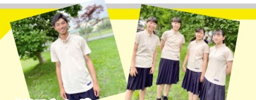
オリジナルポロシャツを製作しました

*本校はInstagram・facebookをはじめました。学校生活の最新情報を掲載しています。ぜひご覧下さい。