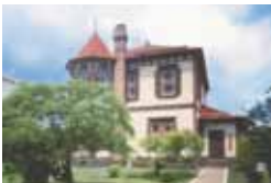
弘前学院外人宣教師館

弘前学院大学は、3学部4学科および大学院2研究科を有する総合大学です。清新で専門性の高い教育と研究を通して幅広い文化の創造、保健医療福祉の向上のために、地域や国際社会で活躍できる人材を育成します。